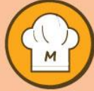
Tabla de Medidas y Equivalencias 2020